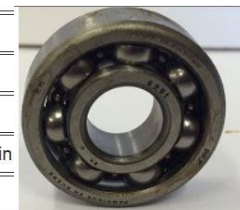
Kullager TYP 6201

Bertil Norlander Ribegatan 24 Lycka till.